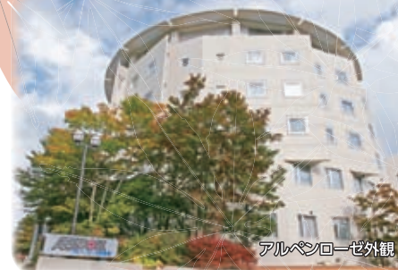
アルペンローゼ外観