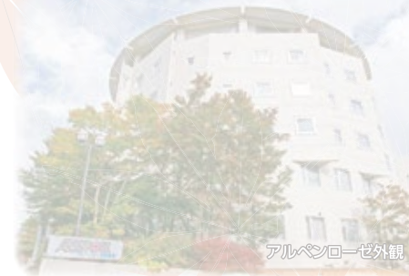
アルペンローゼ外観