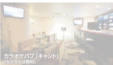
カラオケパブ「キャント」 (カラオケは無料)