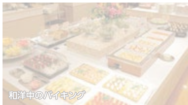
和洋中のバイキング