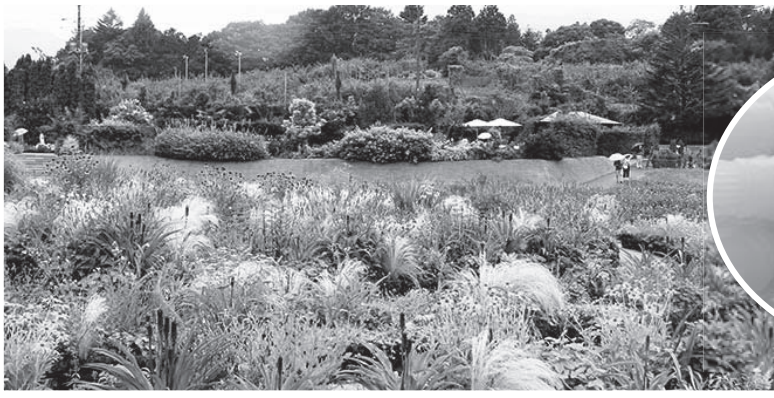
中之条ガーデンズ「スパイラルガーデン」