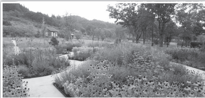
中之条ガーデンズ「ナチュラルガーデン」

※新型コロナウイルスの感染状況により、行程の変更または中止とさせていただきます。