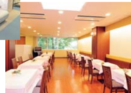
▲「人間ドック専用レストラン」

埼玉県市町村職員共済組合員の皆様には、 販売価格(税抜)より提携割引1%※1が適用となります。