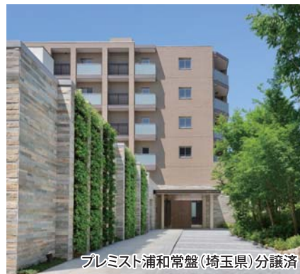
プレミスト浦和常盤(埼玉県)分譲済

※1:一部共同事業物件は除きます。割引の適用には紹介状が必要となります。詳しくは係員にお尋ね下さい。