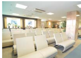
▲「人間ドック専用フロア」