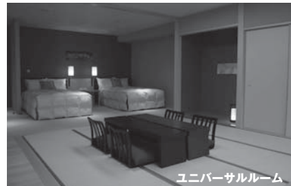
ユニバーサルルーム