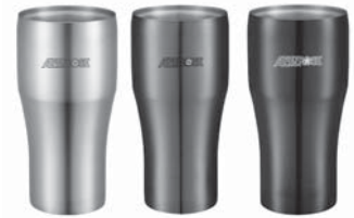
アルペンローゼ名入りタンブラー