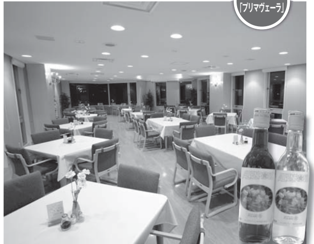
レストラン 「プリマヴェーラ」

レストラン「プリマヴェーラ」では、和・洋・中のメニューにデザートの数も豊富なビュッフェスタイルでお料理をご提供しており、お好きなものをお好きにだけお召上がりいただけます。ご好評いただいている4種類(サーロイン・ヒレ・もち豚・ローストビーフ)のステーキと天ぷらはライブスペースで、ご注文を頂いてから目の前でシェフが調理いたします。焼き加減など自由にお申し付けください。また、大人の方にはグラスワインをサービス。広々とした空間で、ご高齢の方から小さなお子様まで旬の味覚を存分に味わっていただけます。