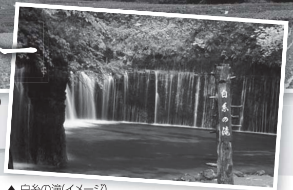
▲ 白糸の滝(イメージ)