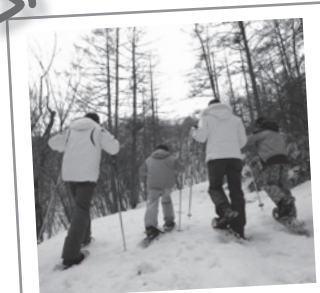
① 冬の森ウォッチング 人気のスノーシューイベントの冬の今しか見られない自然を観察出来ます。

※1ジュニア・シニア料金等あり。2日券：2,000円の助成あり。 ※2一式：板・靴・ストック。利用額1,000円未満の場合、利用券利用不可。 貸出時間：リフト運転開始～17時の内（ナイターは別途設定）。 ※3営業時間9時～21時。プール・温泉コースの1日料金（温泉コースの別料金あり） 土・日・祝日・GW等は別料金。小人：7才～12才、幼児：3才～6才。 *営業日、営業時間等は各施設にご確認ください。